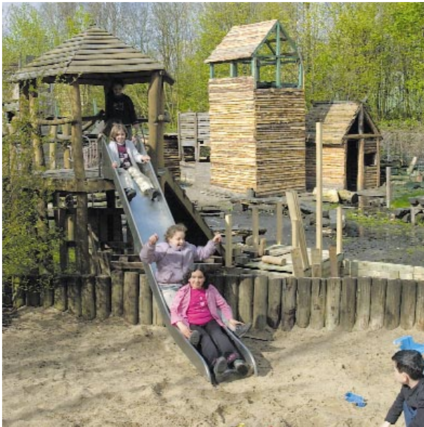
Der Abenteuerspielplatz lockt auf 3 000 Quadratmetern mit Bauplatz, Kleintieren und Lagerfeuer

ritter und Skater nutzen die Wirtschaftswege gern zu ausladenden Touren. Und der Name Erfttal deutet es schon an: Die Erft ist in der Nähe, lockt zu stundenlangen Minitrips fernab von Abgasen und Autolärm. Kinder können sich auf dem Abenteuerspielplatz austoben, selbst zu Hammer und Nägeln greifen und eigene Bretterbuden bauen – das alles unter geschulter Aufsicht. Der 3 000 Quadratmeter große Abenteuerspielplatz lockt auch in den Ferien viele Kinder an – sogar aus anderen Stadtteilen. Denn wo sonst können die Kids lernen, ein Lagerfeuer in Gang zu halten oder richtig mit Bauwerkzeug umzugehen. Im Umgang mit Kaninchen und Hühnern lernen die Kleinen Verantwortung zu übernehmen. Und neben Billard und Kicker darf beim Team des Abenteuerspielplatzes auch der Griff zum Joypad moderner Spielekonsolen gemacht werden. Dem Kindergarten entwachsen, finden Jugendliche im „Kontakt Erfttal“ sinnvolle Freizeitbeschäftigung. Ob beim Band-Projekt an der eigenen CD gefeilt oder einfach nur das Café zum Klönen aufgesucht wird – der „Kontakt“ wird seinem Namen gerecht und hilft, die Unterschiede der zahlreichen Nationalitäten zu überwinden. Angebote gibt es auch für Erwachsene in breiter Palette im Bürgerzentrum: Tanzcafé,