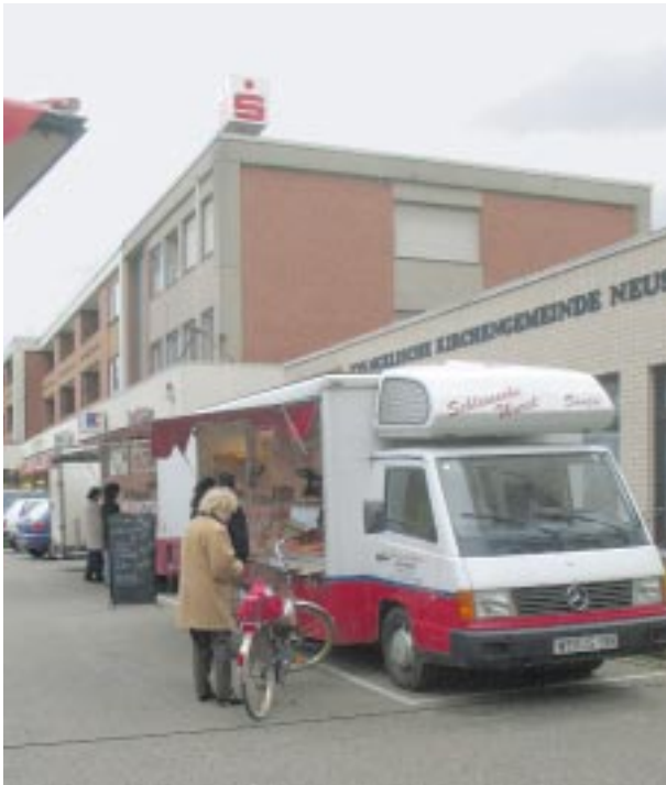
Ein kleiner Wochenmarkt ergänzt das Angebot jeden Donnerstag von 8–14 Uhr

– Aber es bleibt noch viel zu tun – in und für Erfttal! Die im Jahr 2000 auf der Grundlage des „Integrierten Handlungskonzeptes Erfttal“ eingeleitete Entwicklung des Stadtteiles wird in vielen Handlungsfeldern Veränderungen und Verbesserungen bringen (müssen), auch wenn sich viele Anliegen der Bürgerinnen und Bürger nicht „von heute auf morgen lösen lassen“. Die Verantwortlichen in der Stadt Neuss, in Verwaltung und Politik, hoffen hier auf die offene Mitarbeit der Erfttalerinnen und Erfttaler: Sie sind sozusagen die „Experten für den Stadtteil“. Das Zusammenleben von Menschen aus unterschiedlichen Ländern und Kulturen, die Vielfältigkeit des Stadtteiles ist auch eine Ressource, eine Chance für Erfttal.