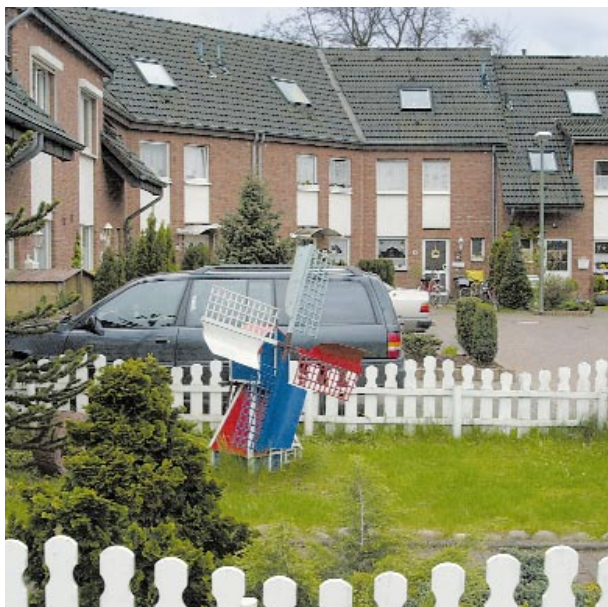
Einfamilienhäuser prägen das Bild Erfttals westlich des Berghäuschensweges

ständigkeit. Für viele traditionsbewusste Neusser war das Anfang der Siebziger ein Novum, das zu leidenschaftlichen Diskussionen geführt hatte. Sportlich Ambitionierte kommen ebenfalls auf ihre Kosten. In der SG Erfttal kann der Fußball getreten, der Handball geschleudert und die Hürde genommen werden. Die Bezirkssportanlage ist fußläufig und Tennis-Freunde schwingen im TC Schwarz Rot Neuss Erfttal das Racket. Wer eher auf Squash, Aerobic oder Sauna steht, findet in der privaten Anlage an der Parisstraße alles, was das Herz begehrt.