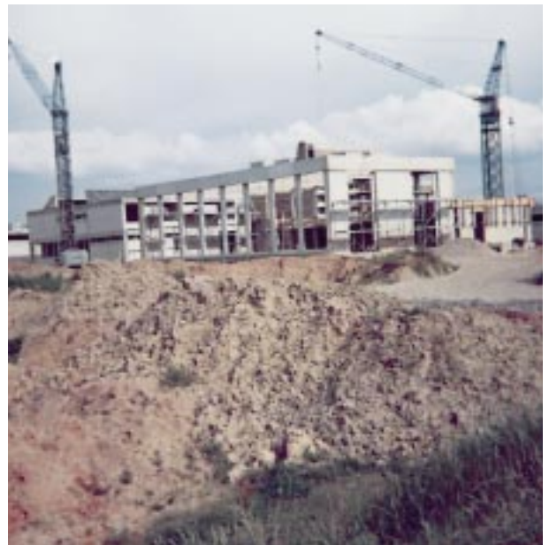
Mit dem Bau der Turnhalle an der Gemeinschaftsgrundschule wird das Sportangebot deutlich erweitert

gebaut. Ende 1994 hatte Erfttal mit 6 825 Einwohnern sein Bevölkerungshoch erreicht. Seit dem nimmt die Zahl kontinuierlich ab. Zur Zeit leben knapp über 6 000 Menschen in Erfttal. Trotz umfangreicher Bemühungen, u.a. in städtebauliche Maßnahmen, in der Modernisierung von Wohnraum, in der Schaffung eines Bürgerzentrums im ehemaligen Autohaus Russin, setzte Mitte der neunziger Jahre für Erfttal eine durchaus problematische Entwicklung ein. Der bis heute anhaltende, stetige Verlust an Bevölkerung ist hier nur Symptom. Der baulich schlechte Zustand von Mietwohnungen, bei gleichzeitig hoher Miete und zunehmend gute Angebote an neuen, preisgünstigen Mietwohnungen in anderen Stadtteilen, verstärkte diese Abwanderungen. Der Zuzug von Menschen aus anderen Ländern und Kulturkreisen, insbesondere auch von Deutschen aus der ehemaligen Sowjetunion, stellt hinsichtlich der kulturellen und sozialen Integration besondere Anforderungen an den Stadtteil, an seine Bürgerinnen und Bürger, an Kirchen und freien Träger der Wohlfahrtspflege aber auch an die Stadt Neuss.