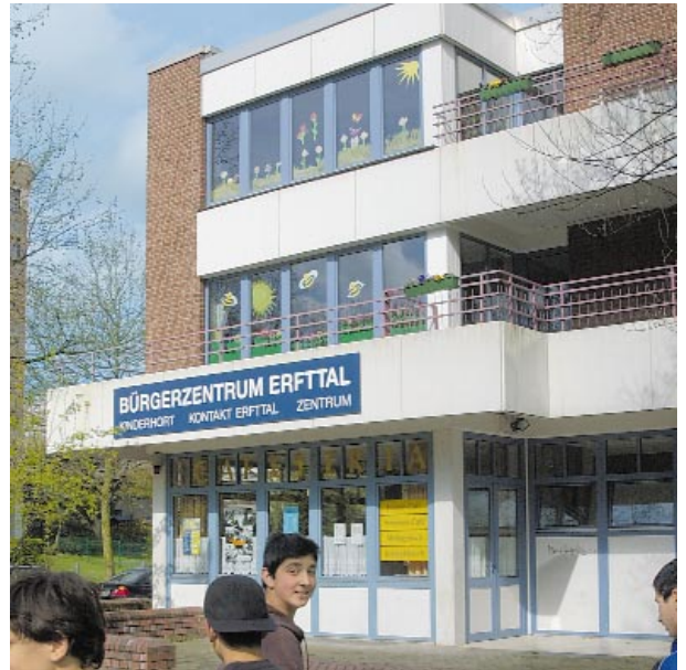
Das Bürgerzentrum Erfttal auf der Bedburger Straße ist Treff für Jung und Alt

Seniorentreff, Mutter-Kind-Gruppen, Kleiderkammer – um nur einige Beispiele zu nennen. Spezielle Beratung und Unterstützung für deutsche und ausländische Bürgerinnen und Bürger bieten u.a. der Sozialdienst kath. Frauen (SKF), der Sozialdienst Kath. Männer (SKM) und das Jugendamt, bis hin zu den Kirchengemeinden, die z.B. auch beim Ausfüllen komplizierter Kindergeld- oder Wohngeldanträge behilflich sind. Erfttal verfügt sogar über eine eigene Stadtteilzeitung und einen eigenen Internet-Auftritt ( www.neuss-erfttal.de ). Bereits seit vielen Jahren engagieren sich Bürgerinnen und Bürger und Vertreterinnen und Vertreter aus den im Stadtteil tätigen Einrichtungen, Diensten, Vereinen und Initiativen, in der „Trägerkonferenz Erfttal“. Sie übernehmen in vielen Dingen des täglichen Lebens und auch in wichtigen grundsätzlichen Fragen Verantwortung und sind verlässliche Partner für die Stadt Neuss. Schützenfest-Freunde finden in Erfttal schnell Anschluss – im Bürger- und Schützenverein, der 1977 gegründet wurde. Dass es dort nicht primär um Bier und Uniform geht, belegen die zahlreichen gemeinnützigen Aufgaben, welche die Schützen in ihrem Heimatort erfüllen. Auch das weibliche Geschlecht darf in Erfttal in Schützenuniform aufmarschieren – keine Selbstver-