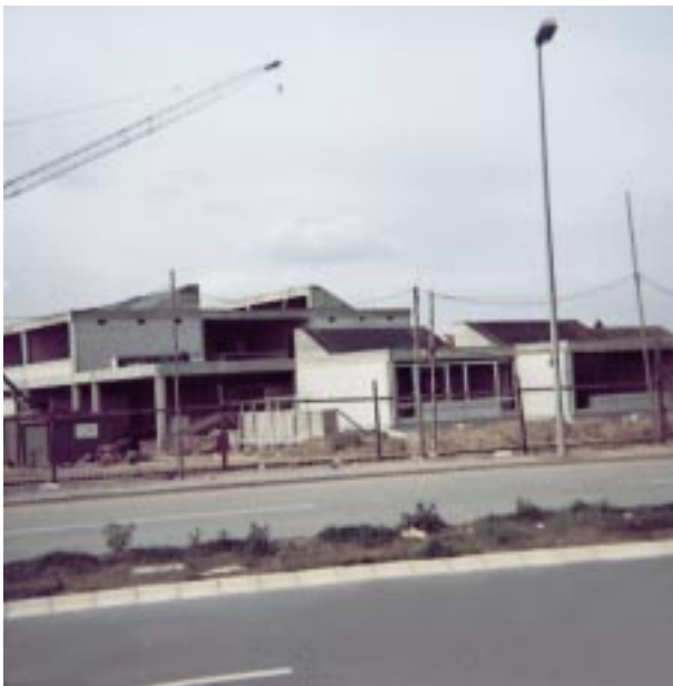
Die Gebrüder-Grimm-Schule entsteht an der Harffer Straße

Umfang auch im westlichen Teil Erfttals befinden sich reine Einfamilienhaus-Zonen. Räumlich eindeutig getrennt davon befinden sich die Hochhäuser: So sind die höchsten Gebäude (bis zu neun Geschosse) südlich der Straßenunterführung Euskirchener Straße, entlang der Bahngleise und des Berghäuschensweges angeordnet. Nördlich davon erreicht die Bebauung drei bis sieben Geschosse. Und östlich der Euskirchener Straße stehen bis zu sechsgeschossige Gebäude. Der Bereich des alten Derikumer Hofes und des Novotels bildet einen Sonderkomplex. Das zeigt sich auch durch die Tatsache, dass die Zufahrt bis zum Hotel von Norf aus erfolgt. Übrigens: Ursprünglich war geplant, die Euskirchener Straße bis nach Norf-Derikum durchzubauen; die Pläne wurden aber nicht realisiert. Nur ein Fuß- und Radweg führt jetzt auf direktem Weg nach Derikum. Mitte der Achtziger Jahre setzte ein zweiter Bevölkerungsschub ein. Die „nächste Generation“ der Erfttaler – zum großen Teil jetzt erwachsen gewordene Söhne und Töchter - suchte nun eigenen Wohnraum möglichst nahe des bisherigen Domizils. So entstand 1986 auf der anderen Seite des Berghäuschensweges Erfttal-West. Die 270 Wohnungen dort bieten Platz für etwa 850 Bürger. Hochhäuser wurden in Erfttal-West keine mehr