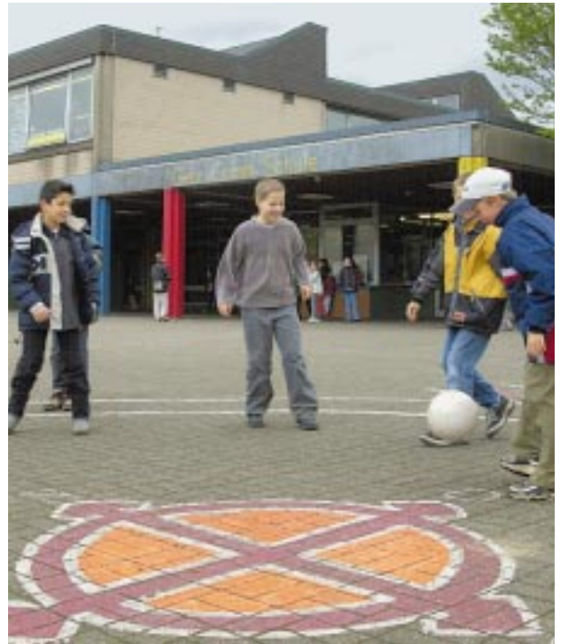
Spielende Kinder in der Gebrüder-Grimm-Schule an der Harffer Straße

Gebrüder-Grimm-Schule Gemeinschaftsgrundschule, Harffer Straße 9-11, Telefon: 0 21 31/16 68 23