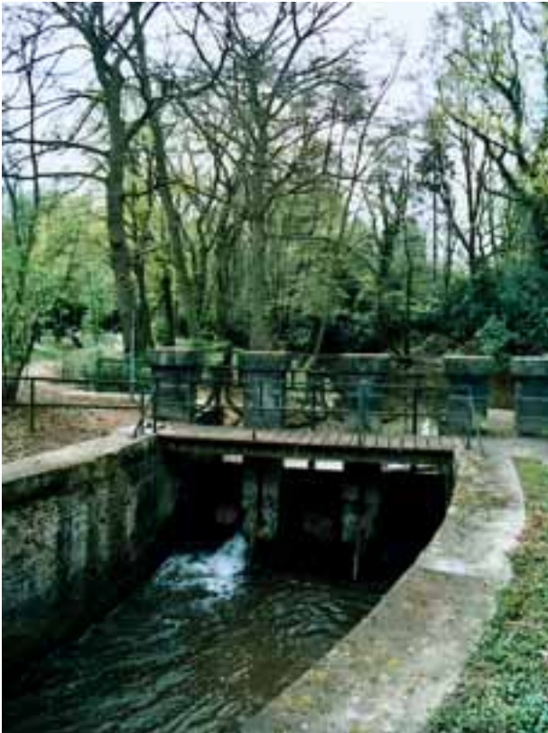
Wasserwehr „Empellement“ im Selikumer Park