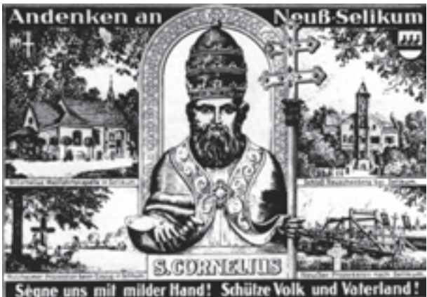
Alte Ansichtskarte von Selikum