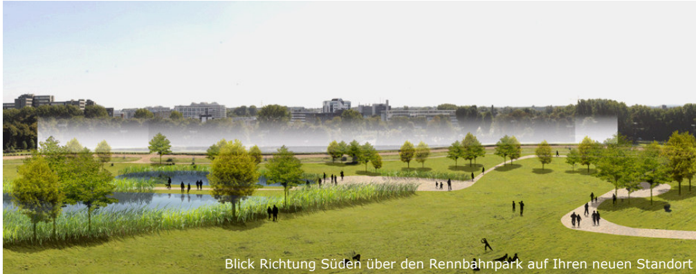
Blick Richtung Süden über den Rennbahnpark auf Ihren neuen Standort