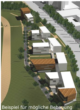
Beispiel für mögliche Bebauung