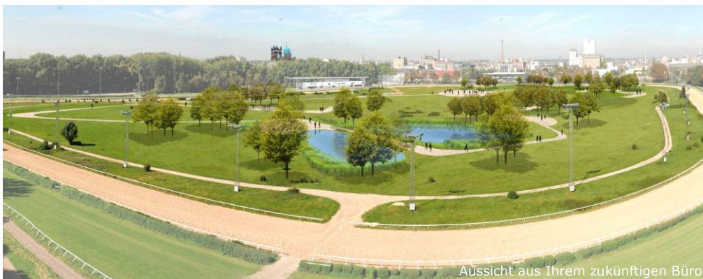
Aussicht aus Ihrem zukünftigen Büro