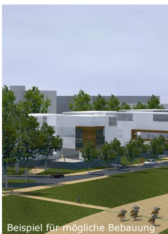
Beispiel für mögliche Bebauung