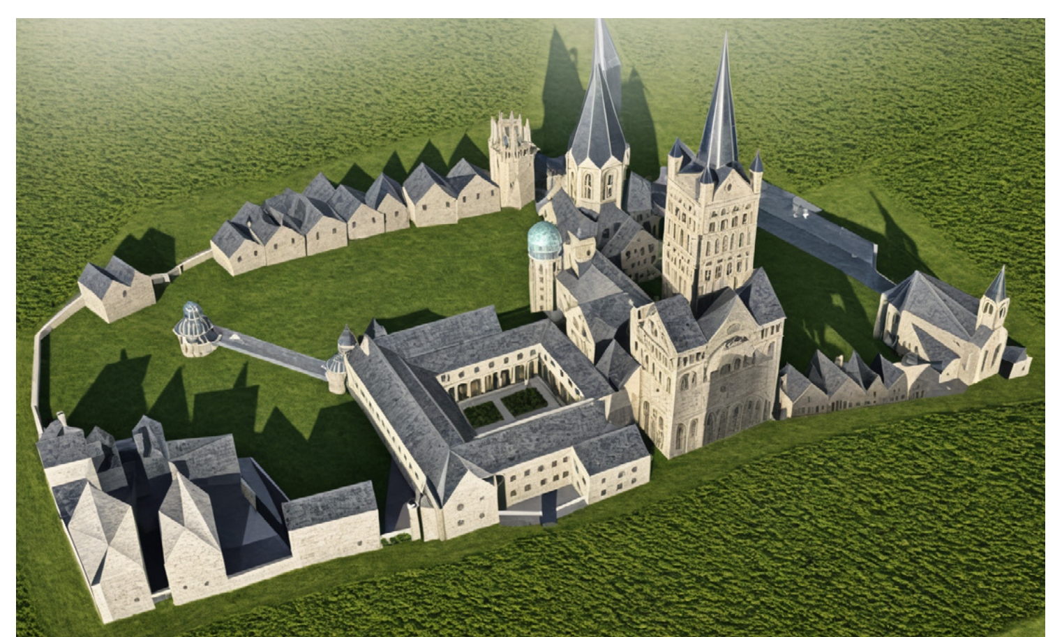
Das Quirinusstift mit Kreuzgang und Versorgungsgebäuden nördlich des Münsters, digitale Rekonstruktion (Martin Stitz, 2025). Außer einem Grundrissplan aus dem Jahr 1802 sind keine Abbildungen des Damenstifts überliefert.

In diesem Zusammenhang ist wohl auch der Neubau der Klosterkirche , des heutigen Quirinusklosters, zu sehen, der 1209 durch Äbtissin Sophia veranlasst wurde. – Nachdem das Damenstift rund 800 Jahre die Stadt- und Kirchengeschichte aktiv mitgestaltet hatte, wurde es 1802 im Zuge der Säkularisation aufgehoben. Die Stiftsdamen flohen über den Rhein, die Stiftsgebäude wurden niedergelegt und die Steine verkauft. Erhalten blieben lediglich einige Keller , die bei archäologischen Grabungen 1979 freigelegt und umgebaut wurden. ( Quellen und Texte: Stadtarchiv Neuss )