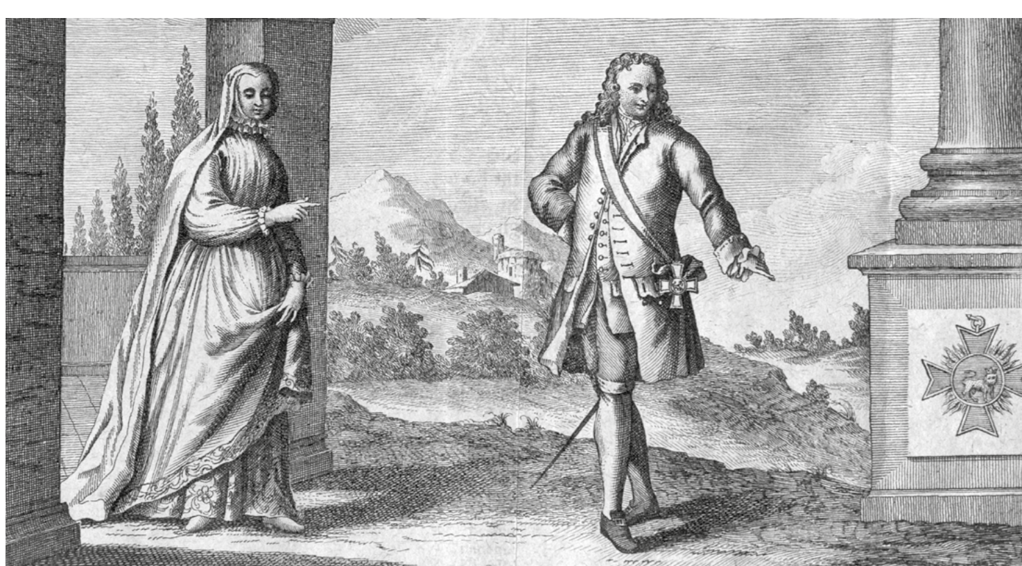
Kanonisse des Quirinusstifts, Kupferstich um 1760