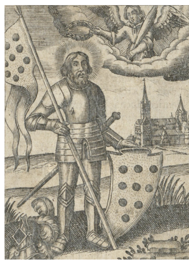
Der heilige Quirin mit der Pfarr- und Stiftskirche, um 1670

Seit seiner Gründung war die Geschichte des Stifts politisch, wirtschaftlich und sozial von einer konfliktreichen Wechselbeziehung mit der Stadt geprägt. Dabei traten die Stiftsdamen als eigenständige, selbstbewusste Akteurinnen auf, die die Geschehnisse von Neuss mitprägten. Neben der sozialen Stellung v. a. der Äbtissin lag dies auch daran, dass das Stift St. Quirin ein wichtiger Wirtschaftsfaktor in der Stadt war. Es verfügte über ausgedehnten Grundbesitz sowie mehrere Mühlen, womit erhebliche Einkünfte erwirtschaftet wurden. Darüber hinaus hatte sich das Kloster seit der Überführung der Gebeine des Heiligen Quirin, die der Legende nach 1050 durch die Äbtissin Gepa erfolgte, zu einem bedeutenden Pilgerzentrum entwickelt und überregionale Bedeutung erlangt.