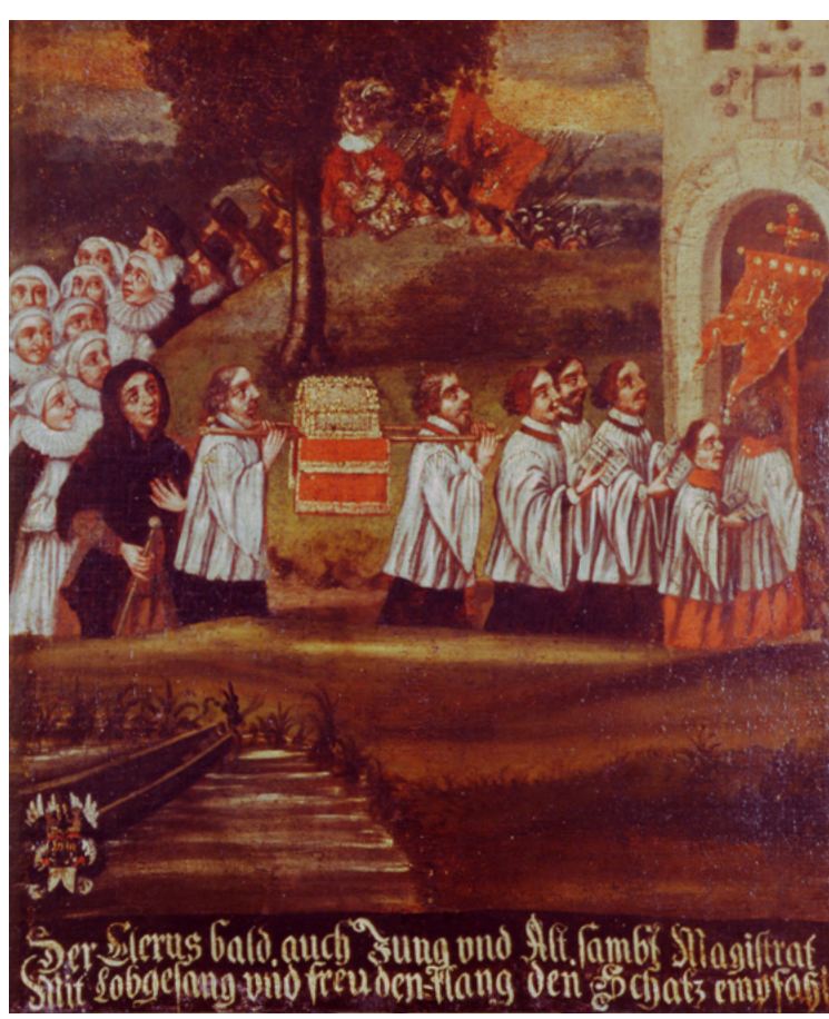
Äbtissin mit Stiftsdamen hinter den Kanonikern und dem Schrein bei der Quirinusprozession, um 1610 (Clemens Sels Museum Neuss, Leihgabe der Pfarrkirche St. Quirin)