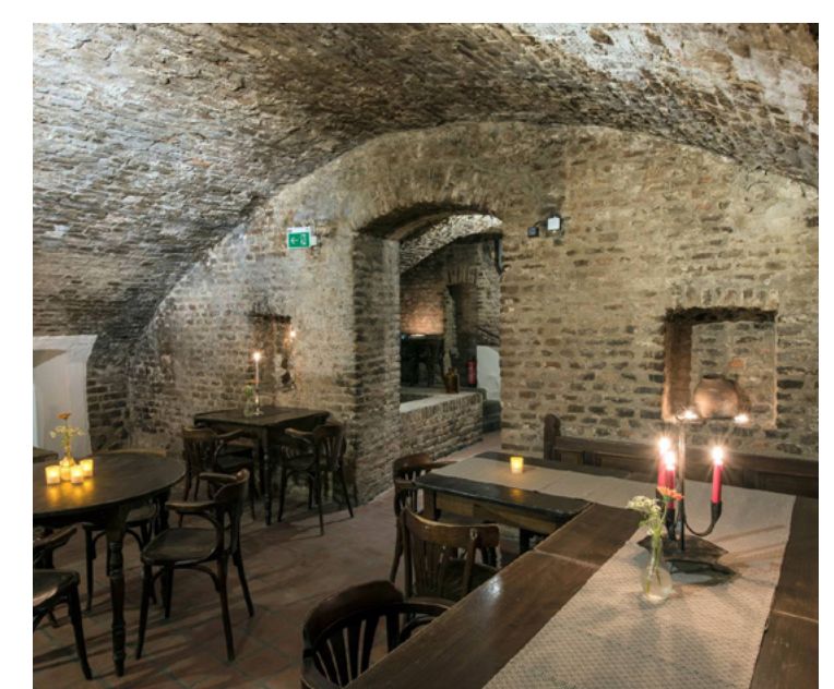
Relikte des ehemaligen Klosterkellers unter den Häusern zwischen Quirinus- und Münsterstraße bei der Freilegung 1979 (Stadt Neuss, Amt für Stadtplanung, Abt. Bodendenkmalpflege) und nach dem Umbau zum Weinlokal „Stiftskeller“, um 2000 (Foto: Thomas Mayer, Neuss)