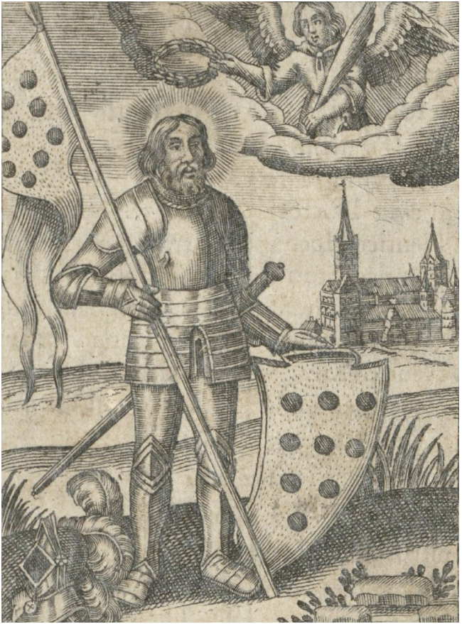
Das ist ein Bild vom Heiligen Quirin etwa aus dem Jahr 1670. Hinter ihm sieht man die Kirche vom Quirinstift mit 2 Kirchtürmen.