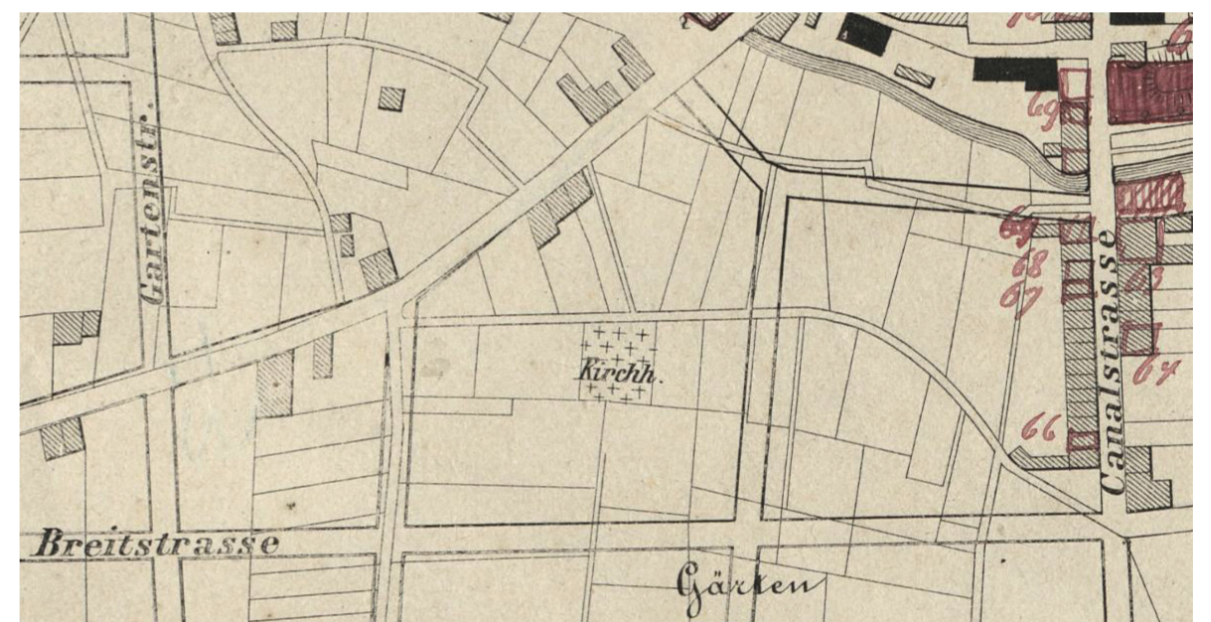
Der alte evangelische Kirchhof zwischen Büttger- und Breite Straße, 1873