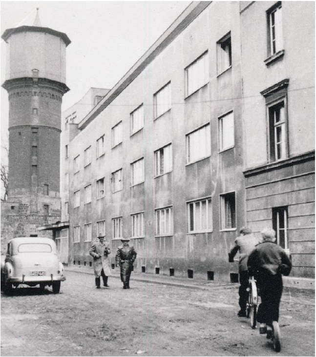
Das ist ein Foto etwa aus dem Jahr 1950. Man sieht links den Windmühlen-Turm. Rechts ist das Stahlhaus zu sehen.