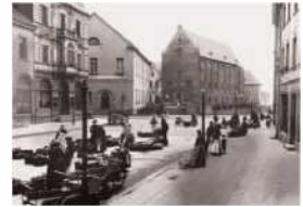
السوق مع المبنى التجاري وصالة Zeughaus، في 1910