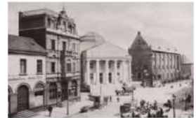
السوق مع المتحف وصالة Zeughaus، في 1912