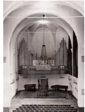
نظرة داخل مبنى Zeughaus كصالة حفلات موسيقية مع الأرغن المشيد عام 1951