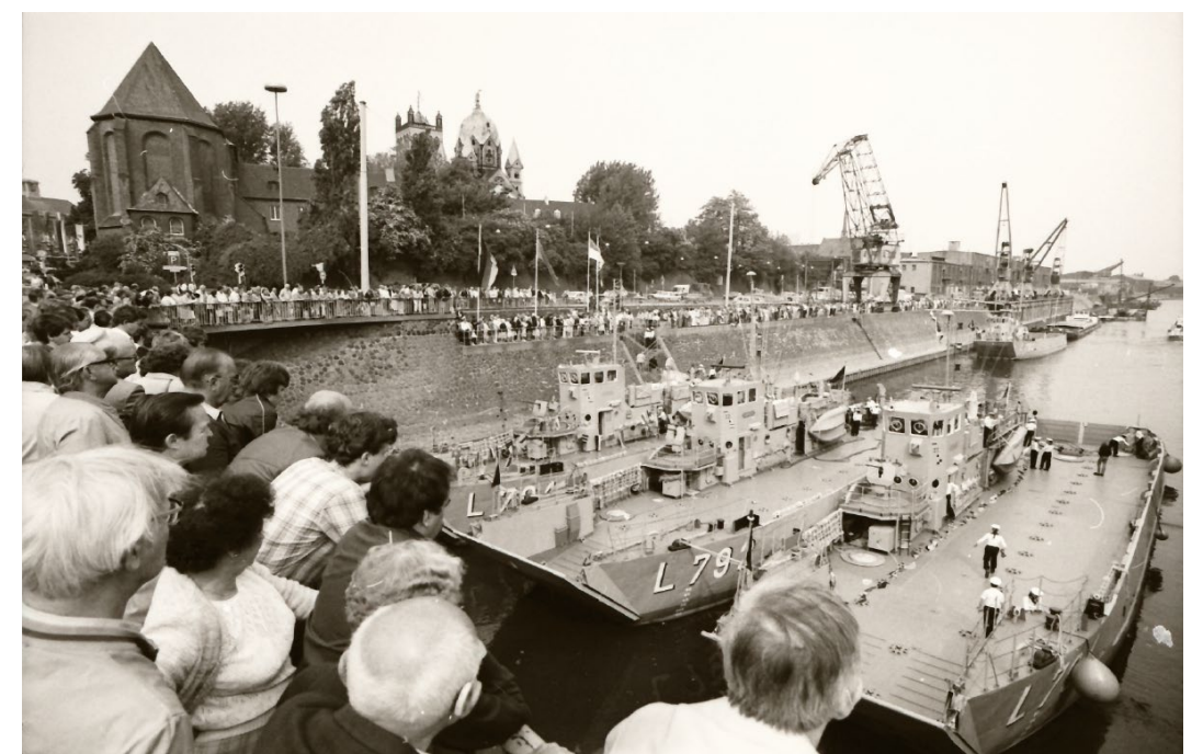
Manifestation au bassin 1 à l'occasion de la 4 e Journée de la Hanse des temps modernes à Neuss sur le Rhin en juin 1984