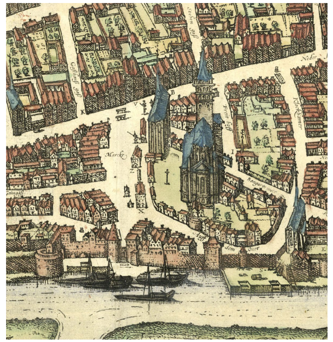
La ville de Neuss avec les embarcadères en dessous du marché, de la basilique Saint-Quirin et du Glockhammer, gravure sur cuivre vers 1590