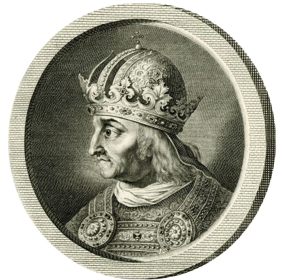
L'empereur Frédéric III. (1415–1493)