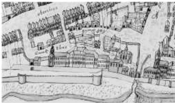
Brückstraße au 18 e siècle