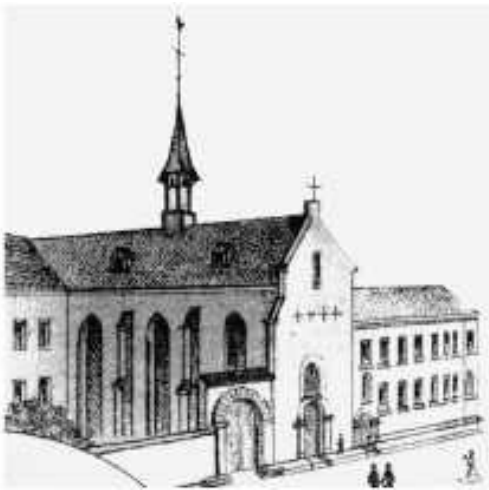
Chapelle et monastère alexiens sur le côté est de Brückstraße (aujourd'hui : Romaneum), 1877