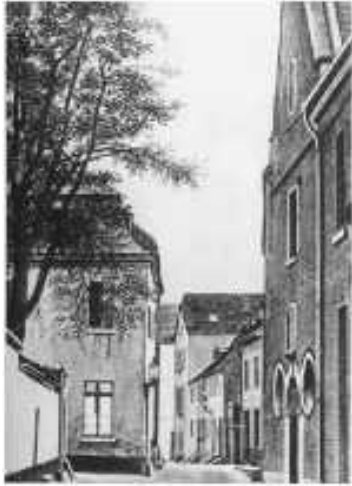
Brückstraße en direction du nord avec la chapelle des Alexiens (à droite), 1930