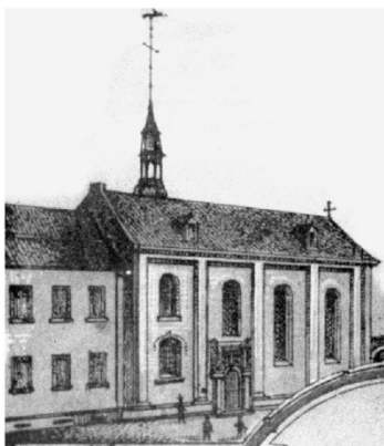
Église de l'hôpital sur le côté ouest de Brückstraße, 1877