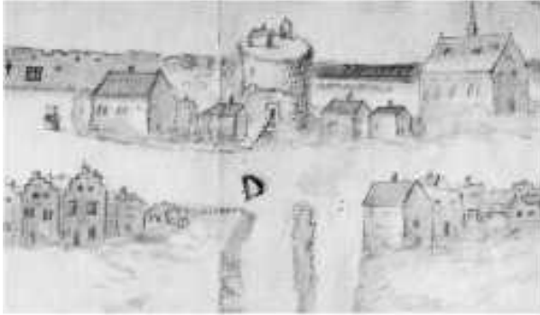
17. yüzyılda Kehlturm kalesi ile Brückstraße