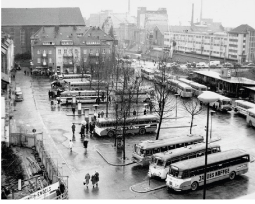
1960 yıllarında otopark