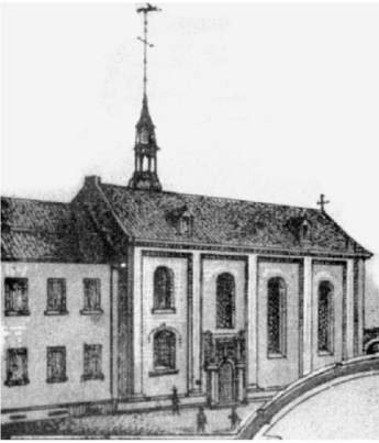
Brückstraße'nin batı tarafında kilise hastanesi, 1877 yıllarında