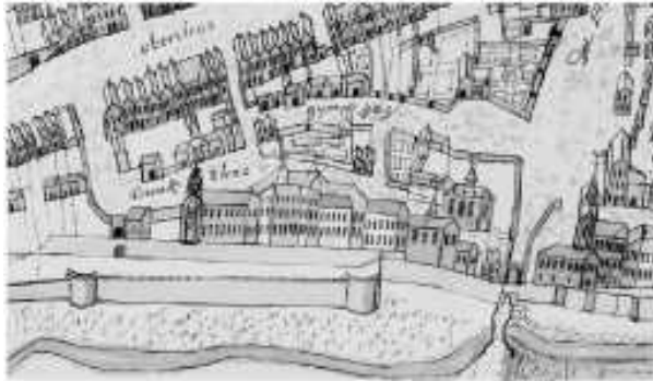
18. yüzyılda Brückstraße