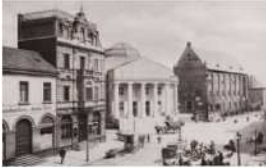
Zeughaus ve müzeli pazar, 1912 yılında