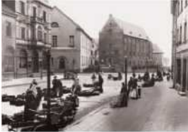
Zeughaus ve mağazalı pazar, 1910 yılında