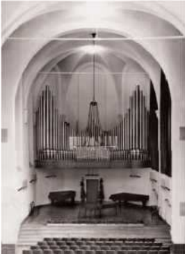
Konser salonu olarak Zeughaus'a bakış 1951 yılında kurulan org ile