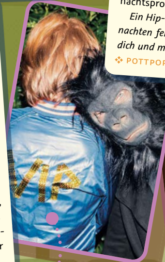
Abbildungen 1 Stefano Trambusti 2 Dana Schmidt 3 Marcel Stränger 4 Henrike Seringhaus 5 Kerstin Schomburg 6 Young-Soo Chang

5 Sonntag, 8. Dezember 2024 11 Uhr & 14 Uhr Dauer ca. 60 Minuten