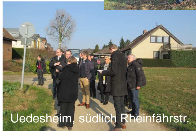
Uedesheim, südlich Rheinfährstr.