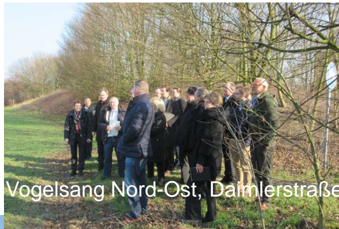
Vogelsang Nord-Ost, Daimlerstraße