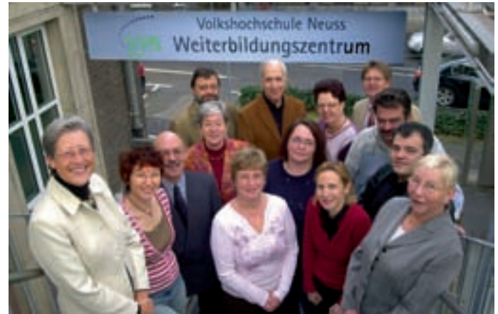
Das Team der Volkshochschule Neuss freut sich auf Sie.